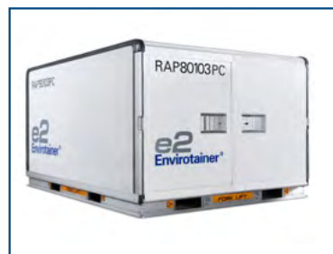
ENVIROTAINER E2 (RAP) Refrigerated container 0°C/+25°C