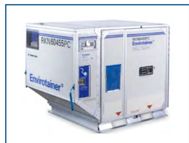
ENVIROTAINER E1 (RKN) Refrigerated container 0°C/+20°C