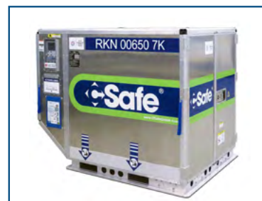
C-SAFE (RKN) Refrigerated container +4°C/+25°C