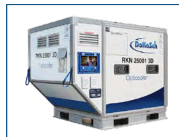
DOKASCH (RKN) Refrigerated container +2°C/+30C