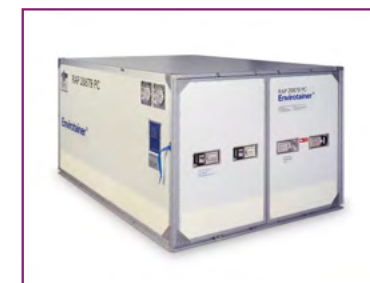
ENVIROTAINER (RAP) Refrigerated container -20°C/+20°C