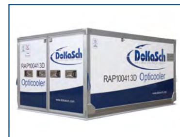
DOKASCH (RAP) Refrigerated container +2°C/+30C