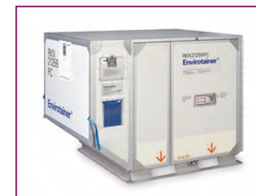
ENVIROTAINER (RKN) Refrigerated container -20°C/+20°C