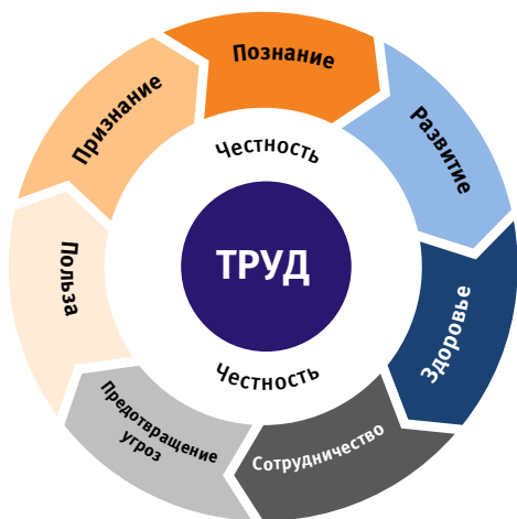
Рисунок 1. Труд как базовая ценность

Честность - это исполнение обязательств перед самим собой и другими людьми, выражающаяся как в намерениях, так и в оценке их исполнения.