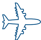
Современный флот Боинг 747

Для получения более детальной информации, пожалуйста, свяжитесь с отделом подбора персонала.