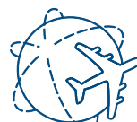
Интересная география полетов